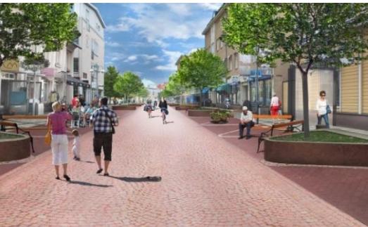
Illustration: Studio Ö.