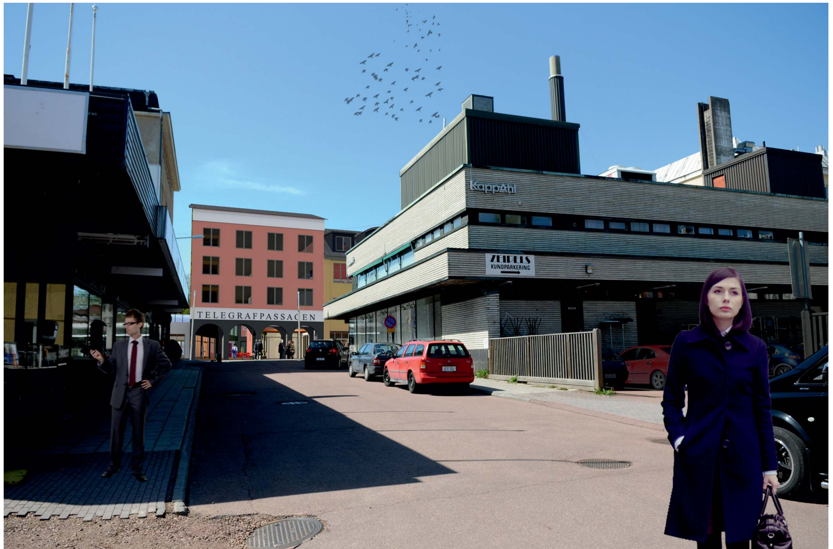
illustration - Ekonomiegatan Österifrån