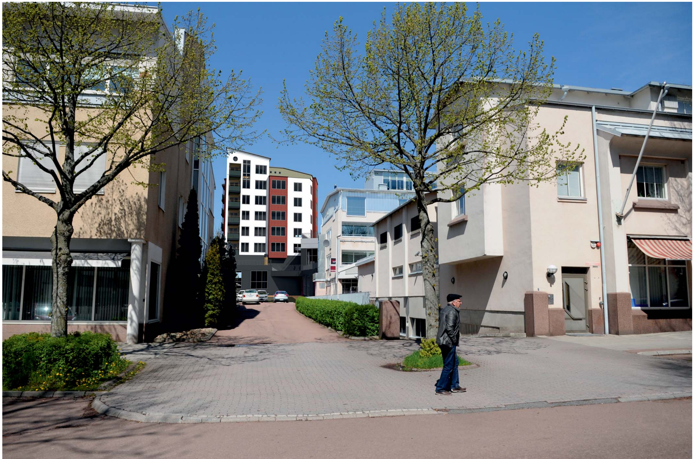
illustration - Norragatan Norrut