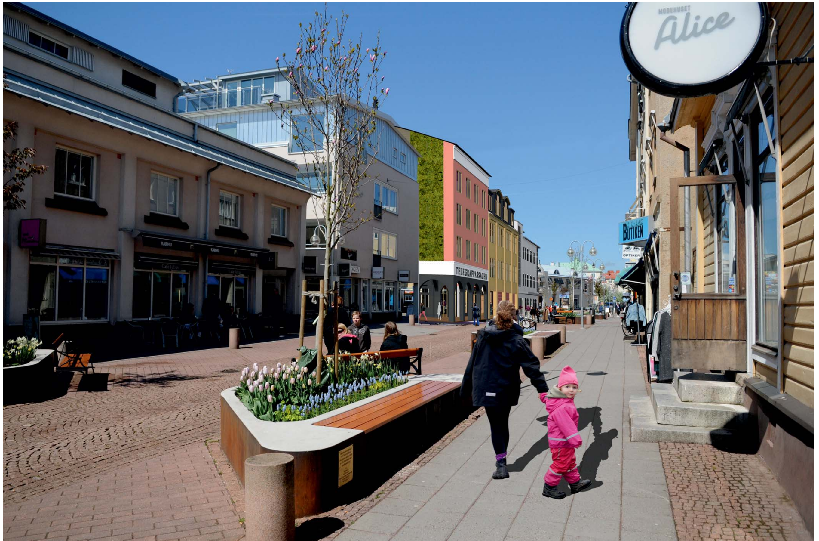
illustration - Torggatan Söderifrån