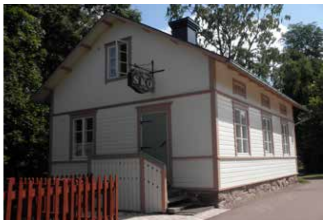
Köpmannagården (Vandring 4, nr 58)