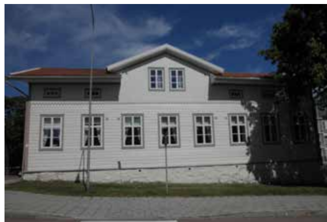
Norra Esplanadgatan 6 (Vandring 4, nr 25)