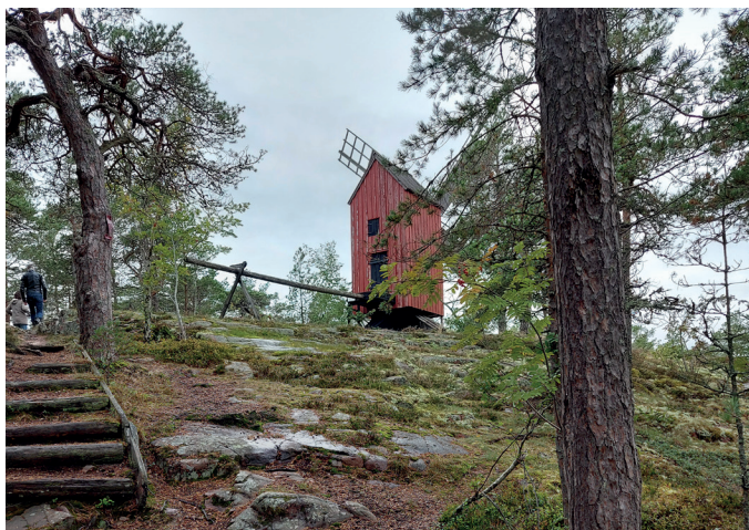
Gravrose under väderkvarn (Vandring 7)