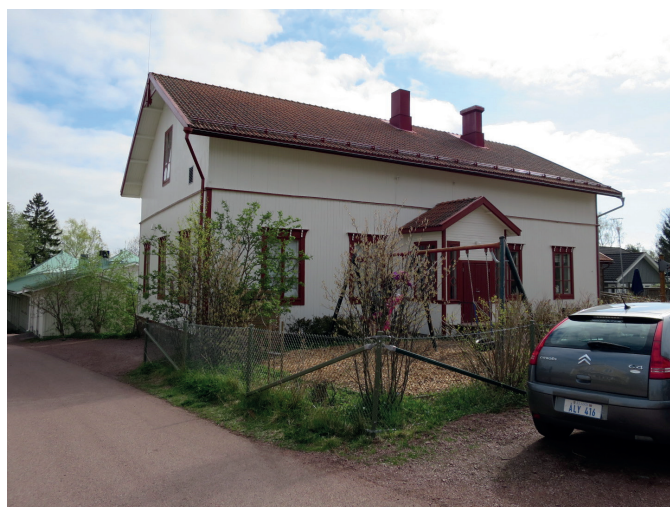
Skolstigen 10 (Vandring 7, nr 2)