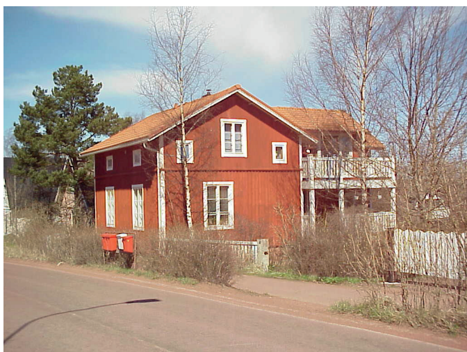
Östernäsvägen 17 (Vandring 7, nr 1)