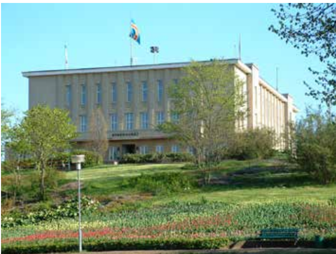
Stadshuset, Torggatan 17 (Vandring 5, nr 39)

Bilderna på K-husen är märkta med vandringsledningens nummer och ledens K-hus nummer (nr i en svart boll på kartan).