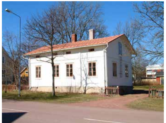
Södragatan 18 a (vandring 5, nr 32)