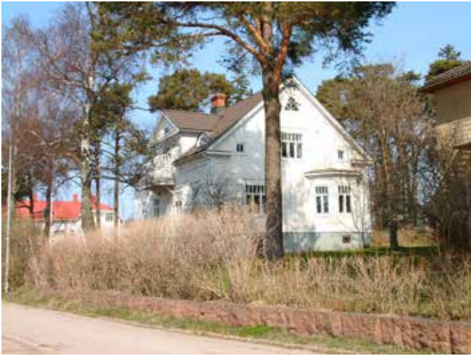
Hamngatan 5 (vandring 4, nr 35 norra huset)