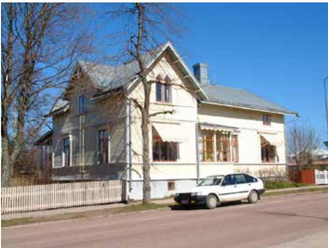
Skillnadsgatan 18 a (vandring 5, nr 55)