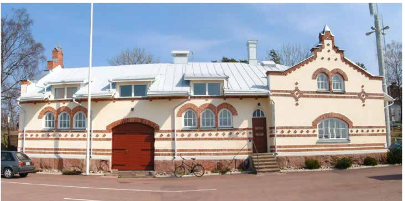
Tullpackhuset (vandring 3, nr 9)