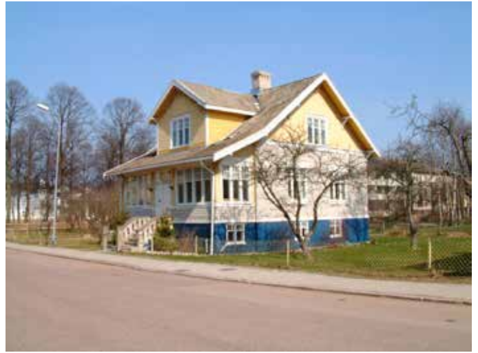
Neptunigatan 39 (vandring 4, nr 16)