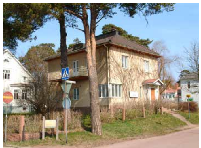
Hamngatan 6 (Vandring 4, nr 35 södra huset)