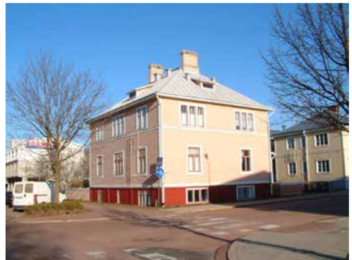
Kaptensgatan 18 (Vandring 5, nr 11)