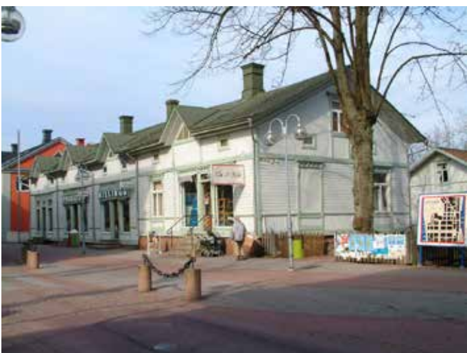
Torggatan 15 (Vandring 5, nr 18)